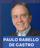
PAULO RABELLO DE CASTRO