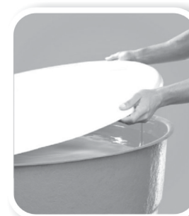
Tampe caixas d'água