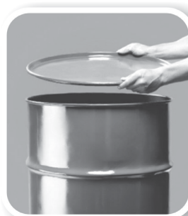
Feche bem tonéis e barris

Defenda sua família, seus vizinhos, sua comunidade. Não basta combater o mosquito. Precisamos eliminar seus criadouros e qualquer local ou recipiente que acumule água parada.