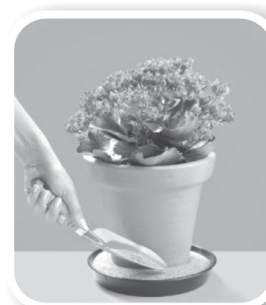
Coloque areia no pratinho dos vasos de plantas